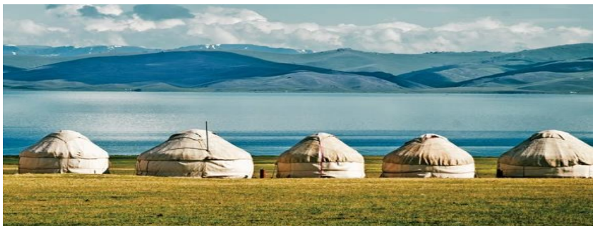
Бул жээктеги боз үйлөрдүн орточо ижара акысы – 1160 сом

Төмөнкү маалыматты карап, кайсы жээк жөнүндө сөз болуп жатканын аныктагыла.