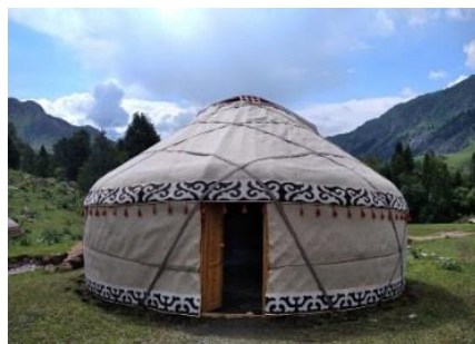
Биринчи боз үй

Боз үй – кыргыз элинин улуттук мүлкү, маданияты. Боз үй көчүп-конууга ылайыкташкан, көчмөн кыргыз элинин каркас, купол сымал-турак жайы. Азыркы учурда Ысык-Көлдө боз үйлөр шаарчасы бар, ал жакка туристтер келип эс алышат.