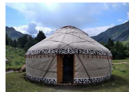
Экинчи боз үй