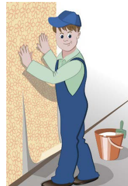
ТАБЛИЦА РАСЧЁТА ОБОЕВ

Эркин бөлмөгө туш кагазды чаптоо үчүн керектүү түрмөктү бөлмөнүн периметри жана бийиктиги боюнча алуунун таблицасын таап алып, өз батыринин башка эки бөлмөсүндөгү туш кагаздарды алмаштырууну чечти.