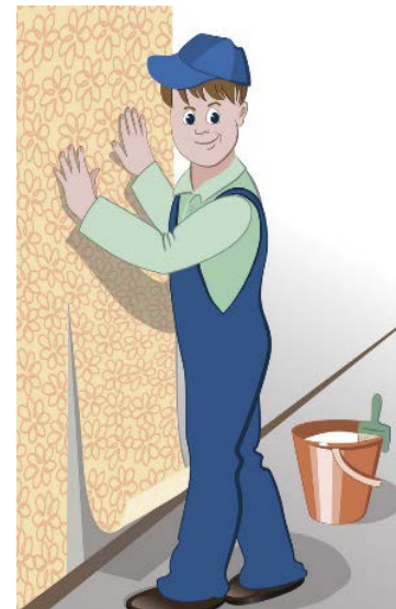
ТАБЛИЦА РАСЧЁТА ОБоеВ

Эркин бөлмөгө туш кагазды чаптоо үчүн керектүү түрмөктү бөлмөнүн периметри жана бийиктиги боюнча алуунун таблицасын таап алып, өз батиринин башка эки бөлмөсүндөгү туш кагаздарды алмаштырууну чечти.